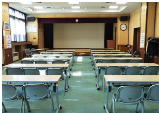
Aホール [スクール型:机3人×10台] [口の字型:机3人×10台]