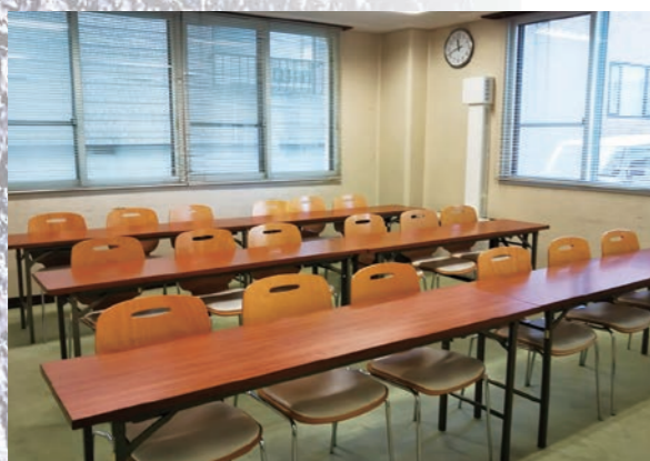
会議室 [スクール型:机3人×6台] 収容人数:18名

全ホールを2つに仕切るとAホール、Bホールとなります。 全ホールの収容人数: スクール型(机3人×20台) 口の字型(机3人×20台) ●椅子収納庫に120脚