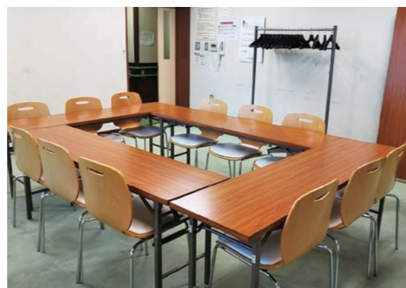
会議室 [口の字型:机3人×6台] 収容人数:18名