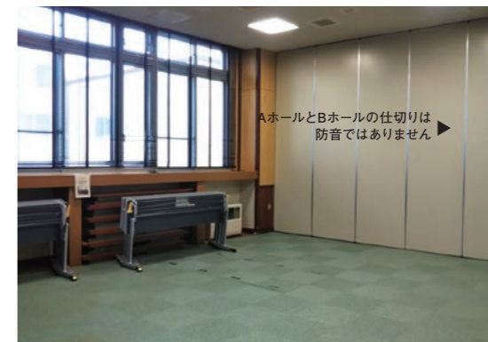
Bホール [スクール型:机3人×10台] [口の字型:机3人×10台]