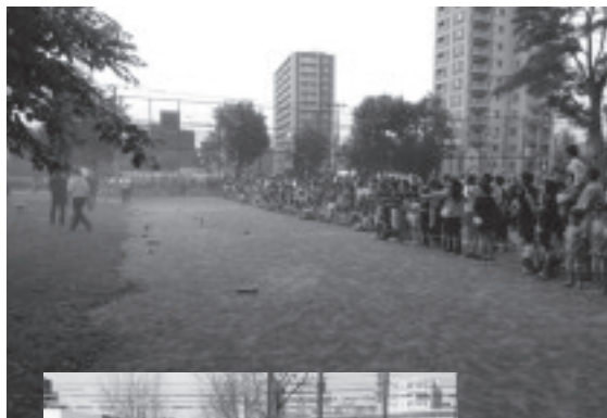
防火のつどい・花火の夕べ