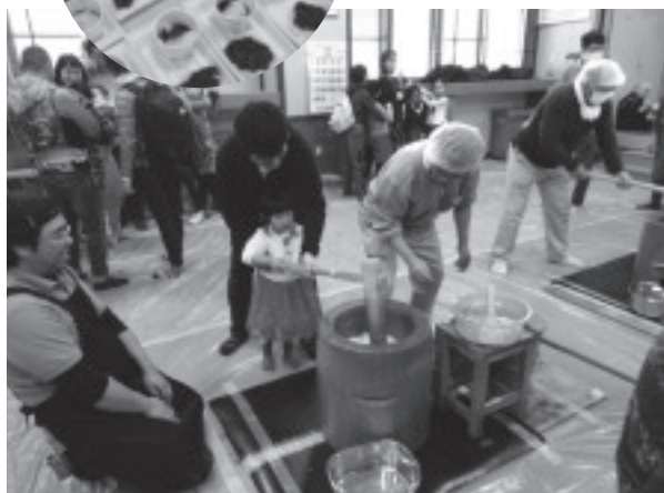
おっ!もちつき大会