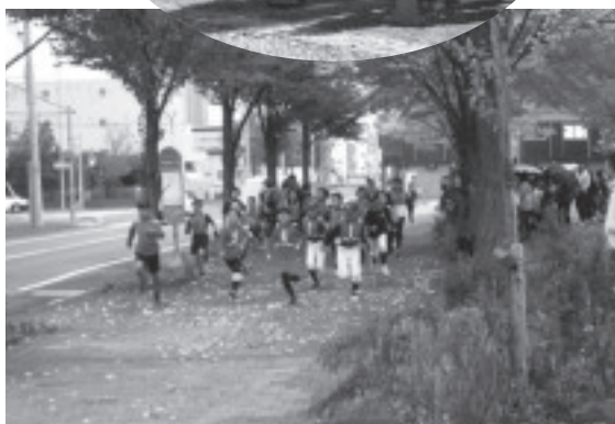
少年少女マラソン大会